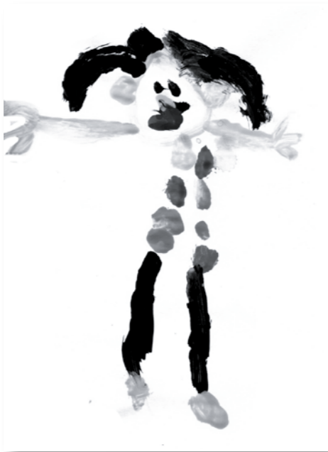
k a o u t h a r

Nizhoni: De gymzaal vind ik altijd heel leuk, de poppenhoek en de leeshoek vind ik soms leuk om te doen.