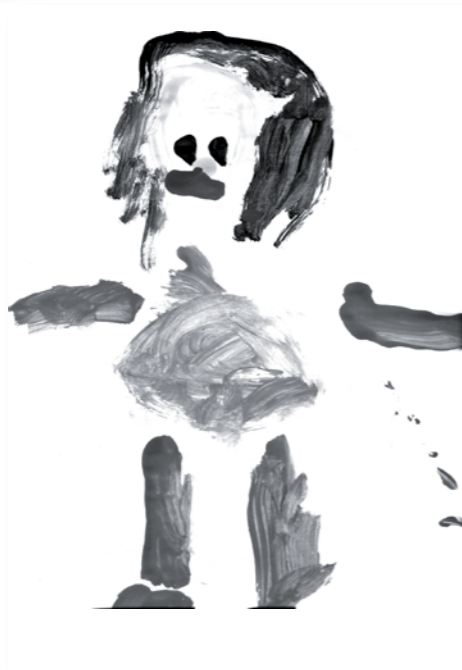
Si ar i e s